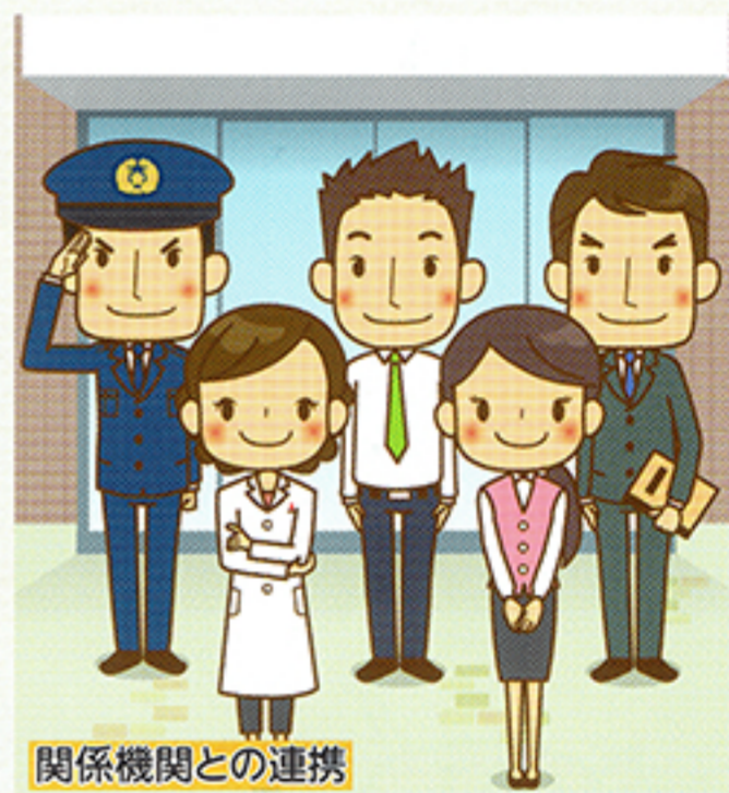
関係機関との連携